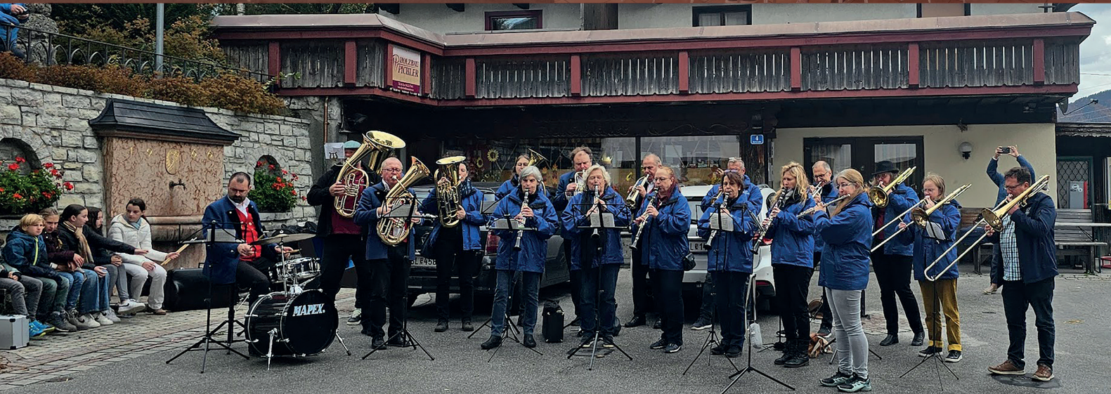
Besuch Stadtkapelle Zirndorf in Koppl, 13.10.2024