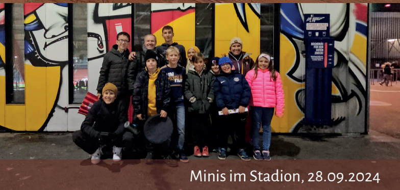
Minis im Stadion, 28.09.2024