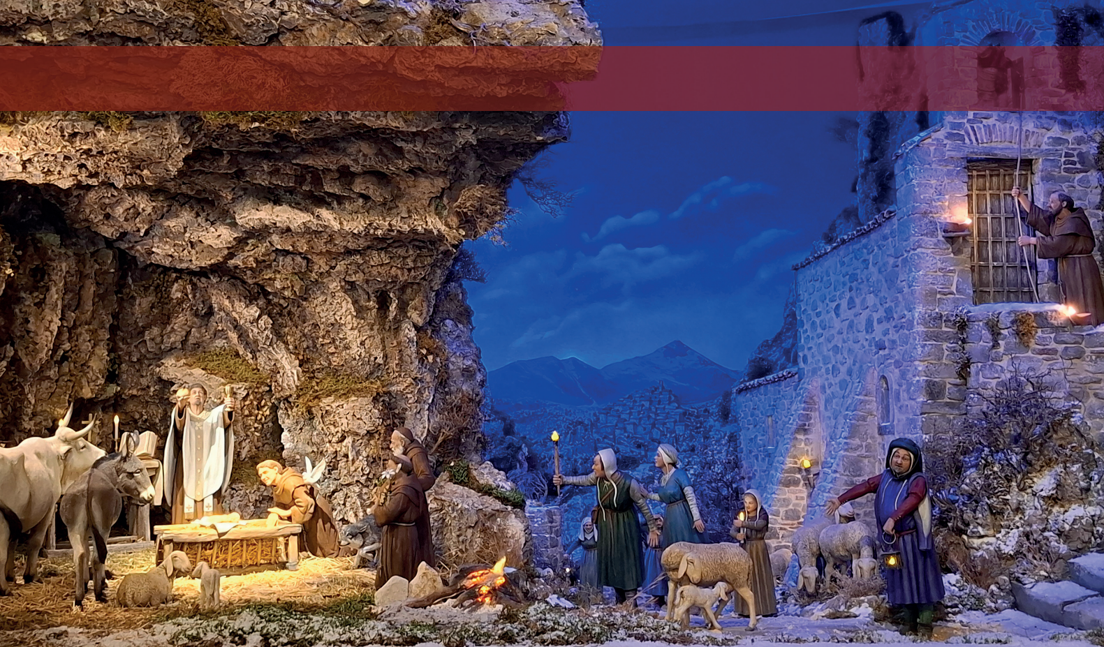
Krippe in Assisi.

Bethlehem ist eine Stadt im Westjordanland. Umgeben von Staaten wie Israel, dem Gaza-Streifen, dem Libanon und Syrien, um nur ein paar Krisengebiete zu nennen. Städtenamen, die ich vom aktuellen Nachrichtendienst stündlich serviert bekomme – ohne noch viel darüber nachzudenken. Bethlehem, eingekreist von Not und Elend, Bomben und Massaker, Armut und Hilflosigkeit. Was für ein brutaler Kontrast zu dem Bild, dass ich gerade vorhin noch in meiner Fantasie mit rosaroten Farben gezeichnet habe.